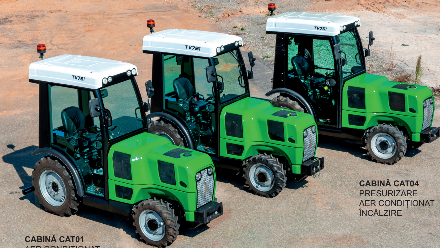
CABINĂ CAT01 AER CONDIȚIONAT ÎNCĂLZIRE